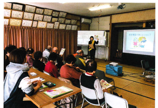
地域での出前講座