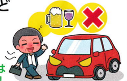
飲酒運転は絶対ダメ！

飲酒運転やあおり運転（妨害運転）は極めて悪質で危険な犯罪です。アルコールは少量の摂取でも安全運転に必要な情報処理能力、注意力、判断力などを低下させ、交通事故の危険を高めます。お酒を飲んだら絶対に車を運転してはいけません。あおり運転もやめましょう。