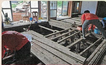
災害ボランティア支援