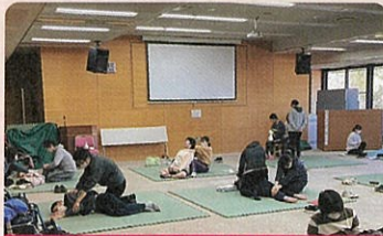
大分県脳性まひ児者父母の会

じぶんの町を少しでも良くしようと頑張っているNPO、ボランティア団体・グループ等の地域福祉活動を応援します。下記のホームページよりお気軽にお問い合わせください。