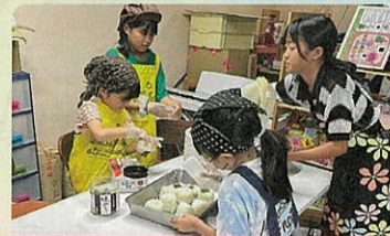
ゆめカフェ・モンスターのがっこう