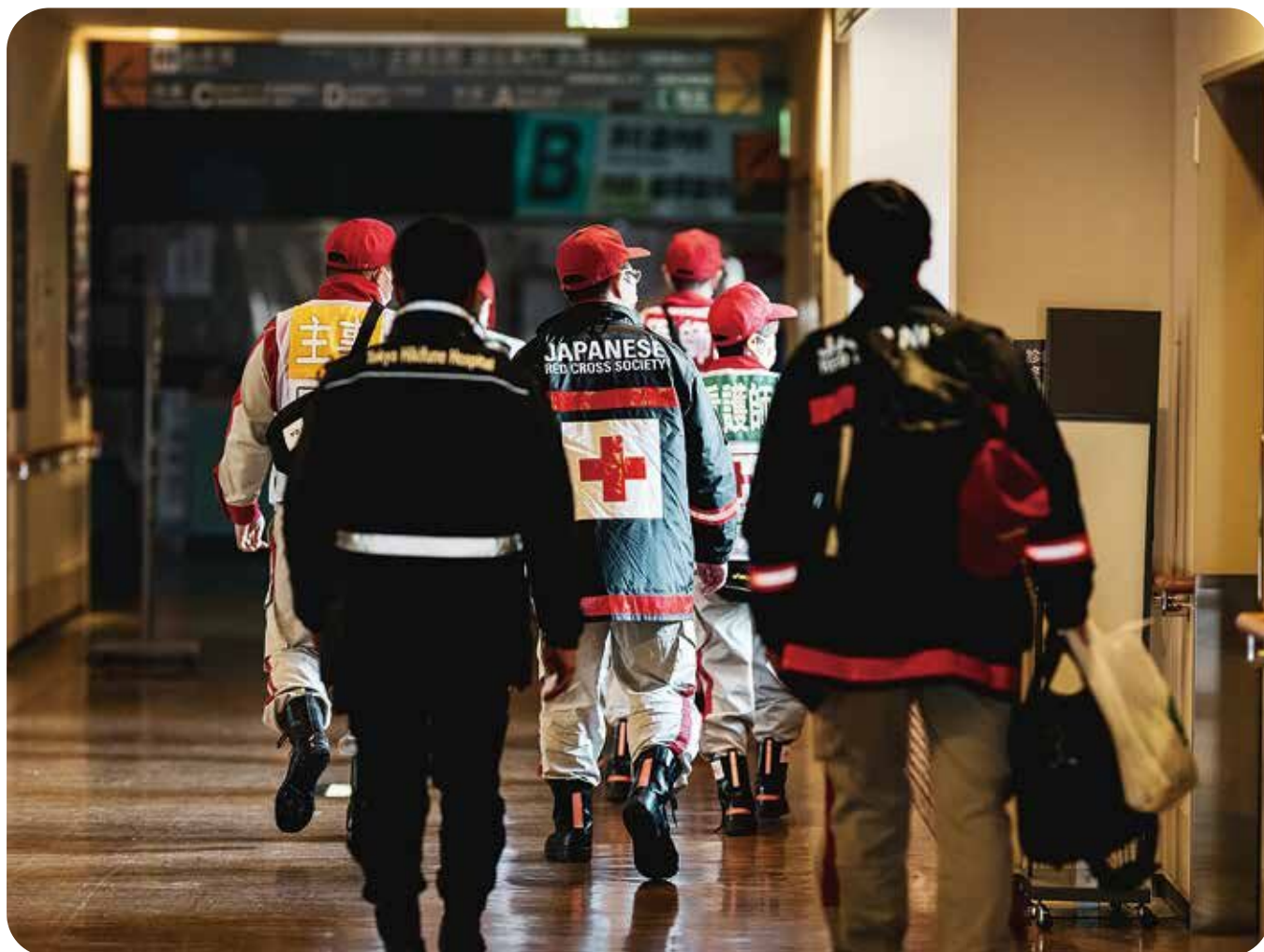
能登半島地震で活動する救護班