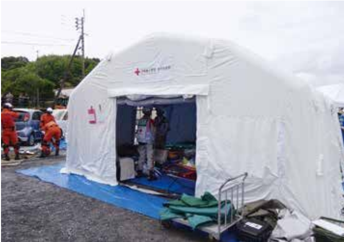
新規エアテント(災害訓練でも活用)

日赤大分県支部には、災害時や大規模事故発生時に応急処置室として使用する医療救護用エアテントを配備しており、既存エアテントを更新しました。