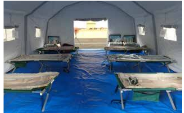
エアテント内の応急処置室

エアテントは、エアの充気のみで設営できるテントで、特徴として、展張時は幅6m×長さ6m×高さ3mとなり、約3分で展張できるため、いつ災害が発生しても対応可能です。また、冷暖房や防水帯を設置でき、遮光性・遮熱性に優れた素材を使用しています。