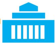
議会同意を経て任命