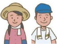
農地利用最適化推進委員

農業委員会が定めた区域ごとに委嘱します。 地域内の「農地利用の最適化の活動」を主に取り組みます。