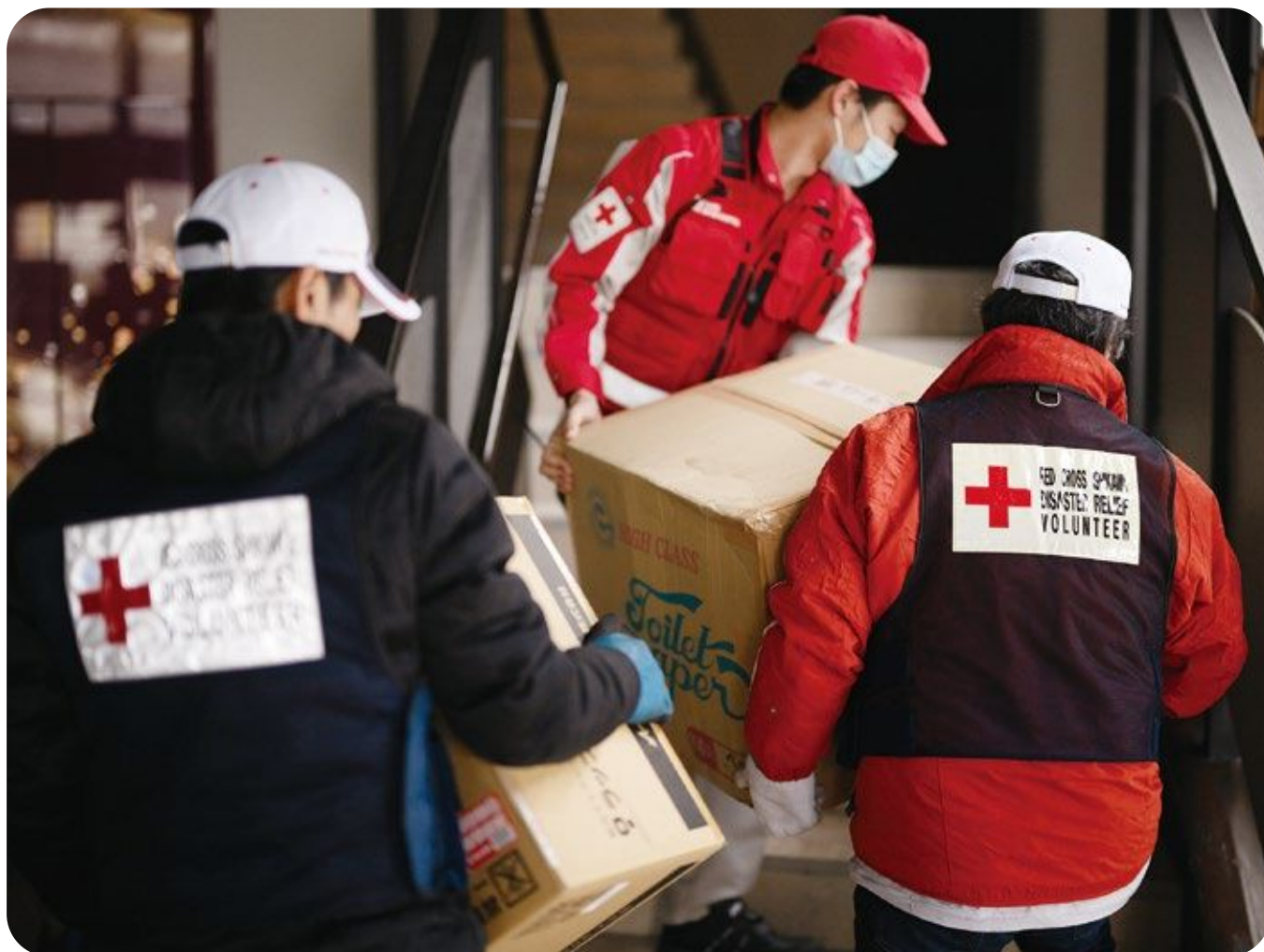
被災地へ救援物資を運ぶ赤十字職員とボランティア (石川県 能登半島)