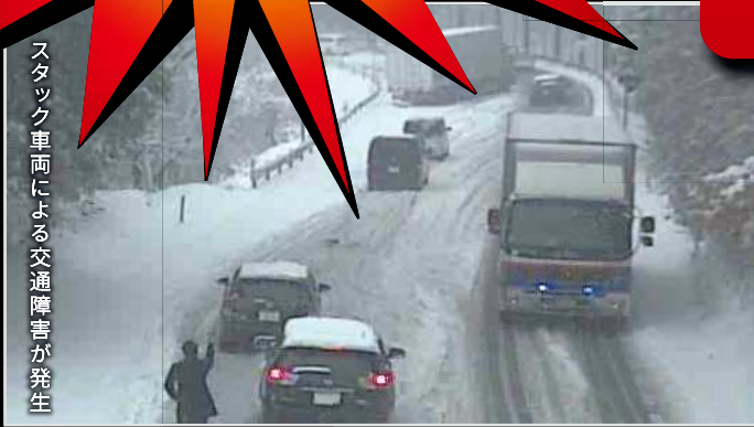
スタック車両による交通障害が発生