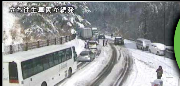
立ち往生車両が続発