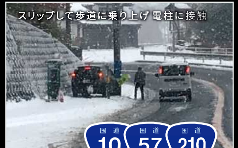
スリップして歩道に乗り上げ電柱に接触