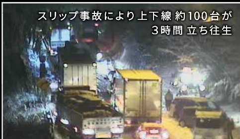
スリップ事故により上下線約100台が3時間立ち往生