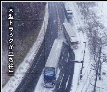
大型トラックが立ち往生