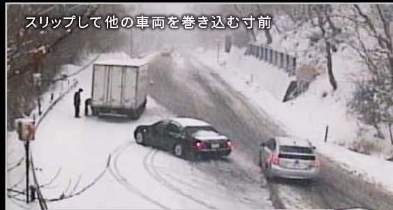
スリップして他の車両を巻き込む寸前