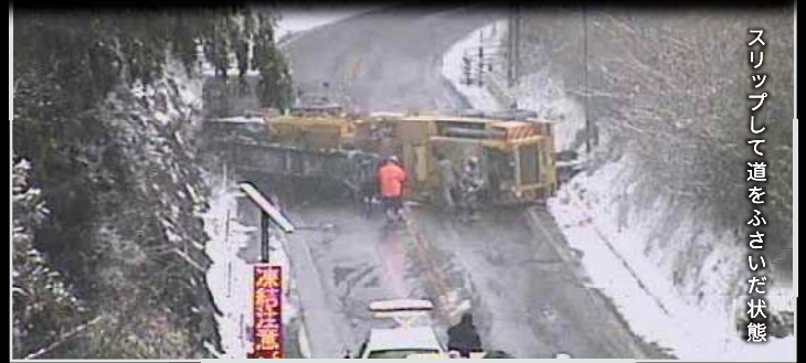
スリップして道をふさいだ状態